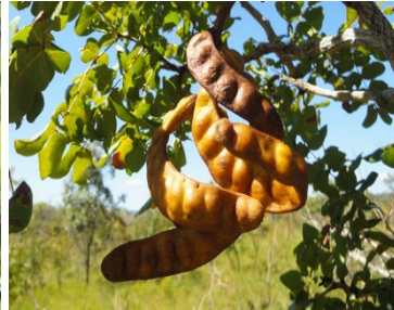
18 Stryphnodendron coriaceum FABACEAE Barbatimão