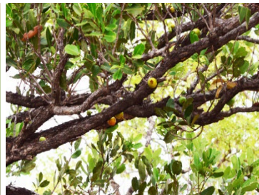
22 Mouriri pusa MELASTOMATACEAE Puçá