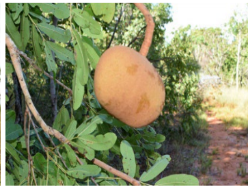
26 Magonia pubescens SAPINDACEAE Tingui