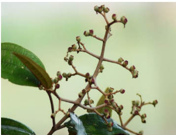
21 Miconia albicans MELASTOMATACEAE Canela-de-velho