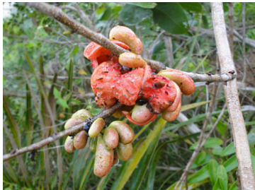
1 Xylopia sericea ANNONACEAE Pindaíba