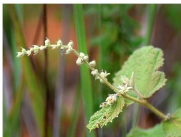
11 Croton pycnadenius EUPHORBIACEAE