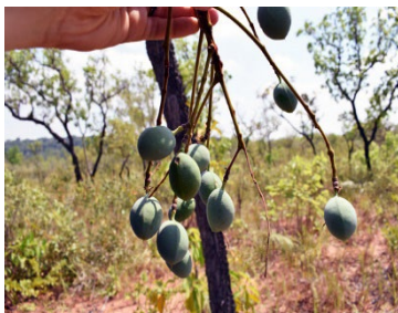
13 Andira vermifuga FABACEAE Angelim