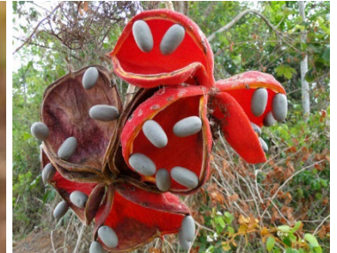
20 Sterculia striata MALVACEAE Chichá