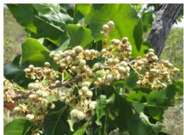
10 Curatella americana DILLENIACEAE Lixeira