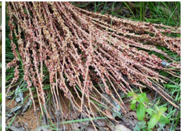
4 Oenocarpus distichus ARECACEAE Bacaba