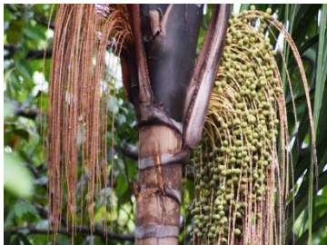
5 Oenocarpus distichus ARECACEAE Bacaba