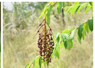
12 Mabea angustifolia EUPHORBIACEAE Taquari