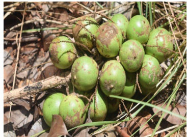
2 Astrocaryum vulgare ARECACEAE Tucum