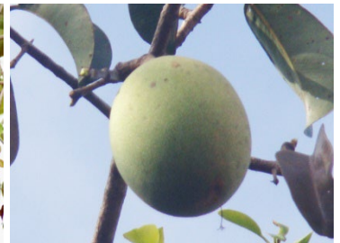
8 Platonia insignis CLUSIACEAE Bacuri