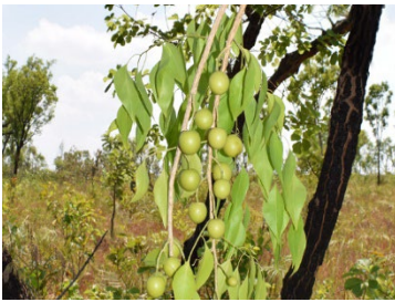
25 Agonandra brasiliensis OPILIACEAE Pau-marfim