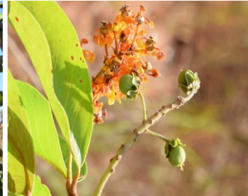
19 Byrsonima crassifolia MALPIGHIACEAE Murici