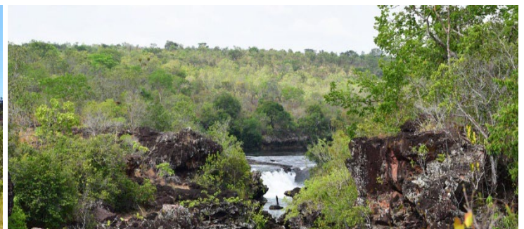
30 Vista do Parque Nacional da Chapada das Mesas, município de Carolina, Maranhão, Brasil.