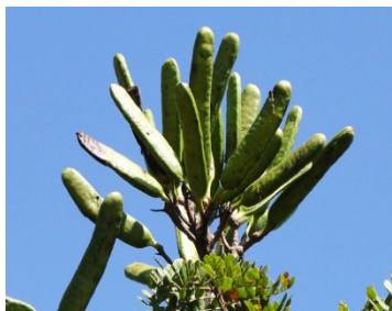
15 Dimorphandra mollis FABACEAE Fava d'anta