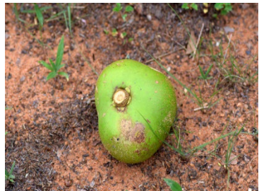
6 Caryocar brasiliense CARYOCARACEAE Pequi