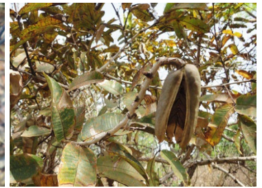
28 Qualea grandiflora VOCHYSIACEAE Pau-terra