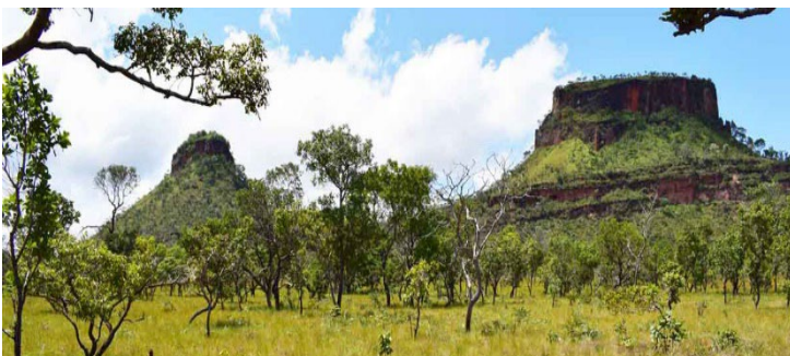
29 Área de coleta da fitofisionomia de cerrado típico no Parque Nacional da Chapada das Mesas, município de Carolina, Maranhão, Brasil.