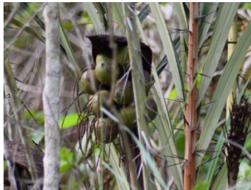
3 Astrocaryum vulgare ARECACEAE Tucum