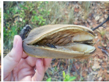
27 Qualea grandiflora VOCHYSIACEAE Pau-terra