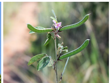
16 Galactia jussiaeana FABACEAE