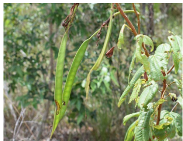
14 Bauhinia dubia FABACEAE