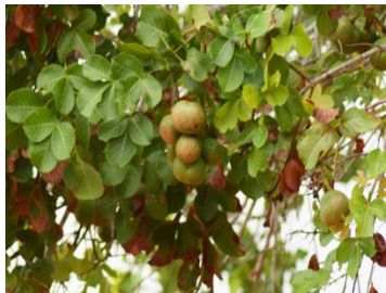
7 Caryocar brasiliense CARYOCARACEAE Pequi