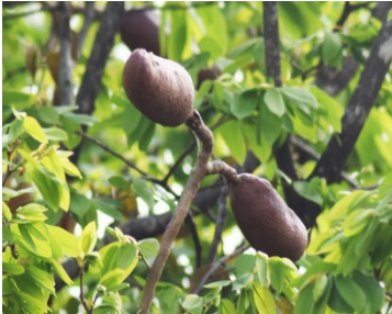
17 Hymenaea courbaril FABACEAE Jatobá