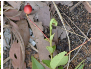
23 Eugenia punicifolia MYRTACEAE Cereja-do-cerrado